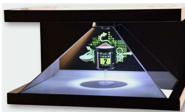
Рис. 3. Голографічні 3D-піраміди для рекламного демонстрування продукції, логотипів компаній тощо. 3D-піраміда дає змогу розглядати предмети з різних боків так, наче вони виставлені на вітрині. Голографічні зображення можуть рухатися та обертатися всередині піраміди.

Голограми використовують для створення спеціальних ефектів у деяких фільмах-блокбастерах. Є навіть окремий напрямок кіноіндустрії – голографічне кіно . Це виробництво і демонстрування фільмів із кольоровими, повністю об'ємними зображенням об'єктів, створеними голографічними методами. Через технічні складнощі голографічне кіно наразі ще не набуло масового поширення. Для свого розвитку воно потребує нових наукових розробок.