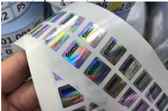
Рис. 4. Голографічні етикетки.

Голографічні товарні знаки (наклейки, етикетки – див. рис. 4) – це надійний і недорогий спосіб маркування виробів, який є підтвердженням їх оригінальності і захистом від фальсифікації. Голографічні знаки також використовують для захисту документів, пропусків, персональних банківських пластикових карт тощо.