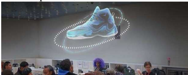
Рис. 2. Голографічне зображення предмета, який «висить» у повітрі.

Голографію широко використовують у різних сферах людської діяльності, зокрема, в медицині, науці, техніці, мистецтві, бізнесі та рекламі. Так, у разі презентації продукції використовують голографічні 3D-зображення, які наче зависають у повітрі (рис. 2) або голографічні зображення всередині т. зв. 3D-пірамід (рис. 3). Цікаві сучасні приклади використання голограм включають навіть голографічні 3D-зображення промовців.